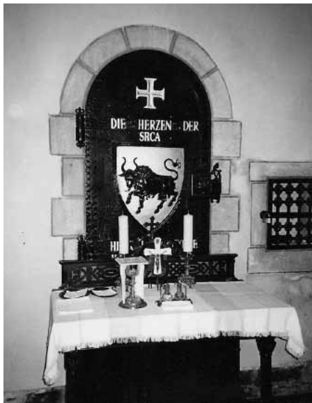
Nische mit den Herzen der Auersperg

Schon längst hatten mittlerweile die Schießscharten in den Festungsmauern und die die Luglöcher auf den Wehrthürmen ihre Bedeutung verloren; die Stadtmauer selbst war allmählich zerbröckelt und zerfallen, der