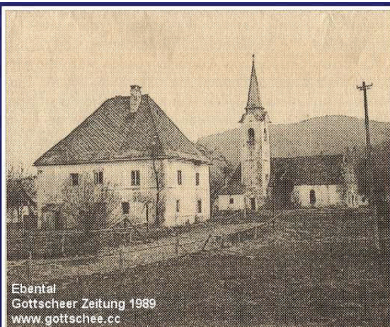
Ebental Gottscheer Zeitung 1989 www.gottschee.cc